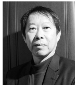
村尾 修 教授